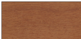
UV-Natur (auf Teakholz)